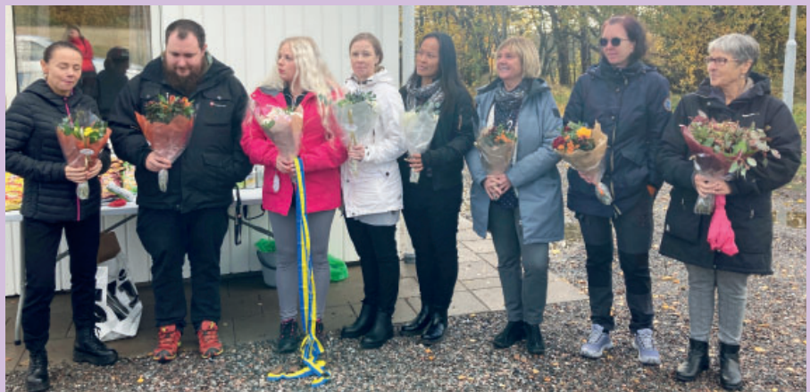
Det uppskattade Kvällsteamet med blommor i famnen under invigningsceremonin.

Under år 2016 man fick ett tydligt politiskt