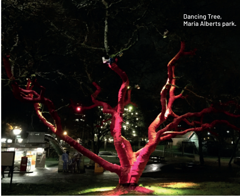
Dancing Tree, Maria Alberts park.