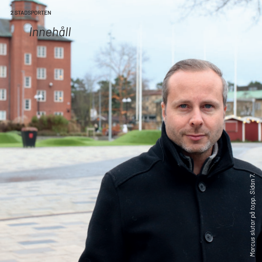
Marcus slutar på topp. Sidan 7.