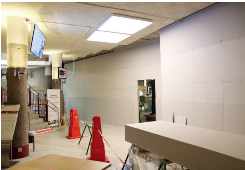
Byggväggen i stadshusets entré fungerar som en avgränsning för bland annat damm och ljud.